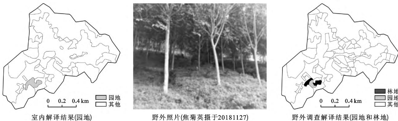
图 3 泰国样区 15 号抽样单元室内解译与野外调查对比

3.2.2 水土保持措施分类精度分析 泰国北部多采用人工种植经果林, 兼顾经济效益和水土保持效益。表 7 表明, 基于 Google Earth 影像和野外调查解译的四旁林措施和土坎水平梯田面积一致性相对较高, 人工乔木林和经果林解译面积一致性较低, 主要由于土地利用类型解译错误, 造成对应生物措施的面积不一致(如林地错分为园地, 导致室内解译的经果林面积偏大)。