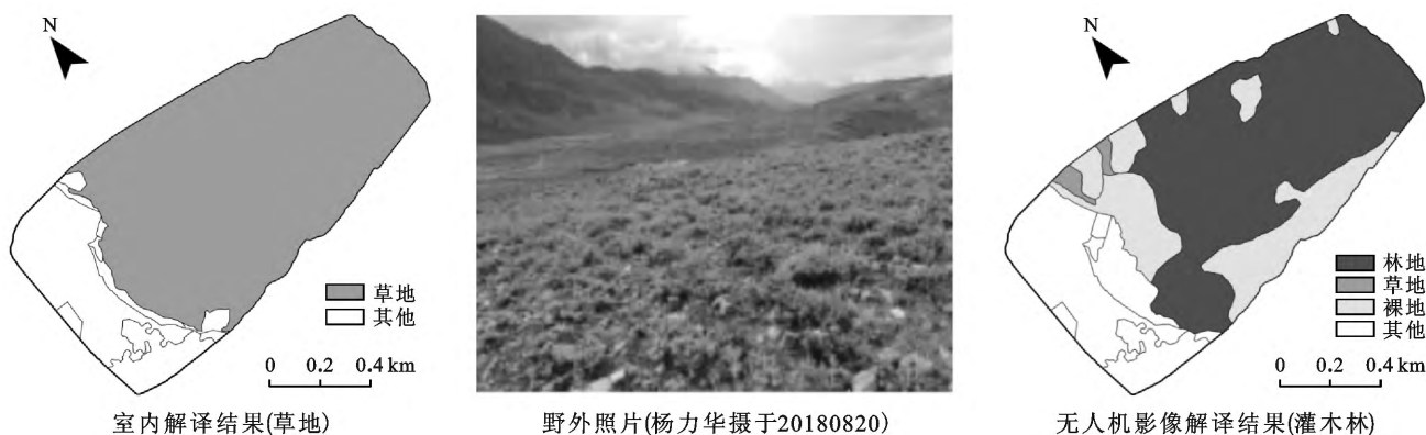
图 2 西藏样区 5 号抽样单元室内解译与野外调查对比

3.1.2 水土保持措施分类精度分析 野外调查(表 4)表明,基于 Google Earth 影像解译和无人机影像解译的人工乔木林措施、水平阶措施面积一致性较好,四旁林措施面积相差较大。西藏东南部处于高寒地区,谷歌影像颜色多呈灰白色,建设用地周边零碎的四旁树较难划分,导致该种生物措施的面积解译出现较大偏差。总体上看,水土保持措施的解译尚比较理想。