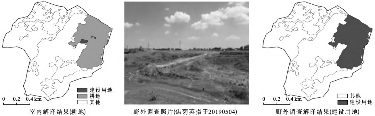
图 4 巴基斯坦 9 号抽样单元室内解译与野外调查对比

3.3.2 水土保持措施分类精度分析 巴基斯坦北部样区地物类型相对而言比较简单,水土保持措施判读精度总体较好。表 10 表明,两种方法解译的四旁林、经果林面积一致性很高,土坎水平梯田解译精度欠佳,主要因为波特瓦尔高原地形多变,土坎水平梯田较多且较为分散,由于影像拍摄角度等,一些沟底耕地水保工程措施难以识别。此外,该区草本植物植株较低,人工种草措施在影像上纹理不清楚,出现室内解译漏判情况。