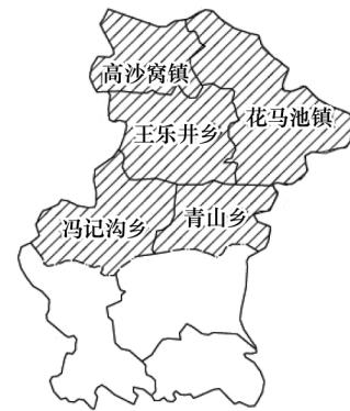
图1 研究区地理位置示意图